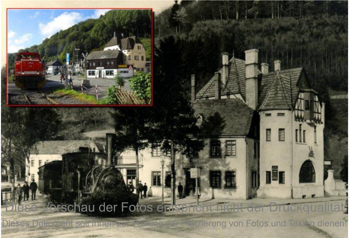
Fast ein Jahrhundert dürfte zwischen beiden Bildern am Jägerhaus in Arnberg liegen.