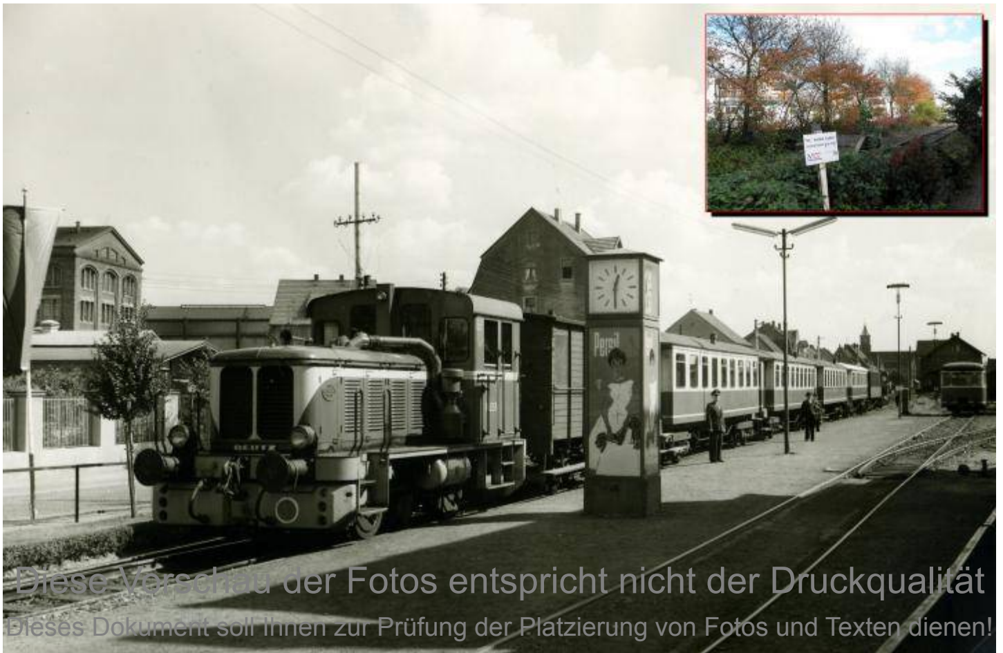
Neheim-Hüsten Kleinbahnhof: Ein Gleisstumpf mit Prellbock ist heute geblieben wo in den 60er Jahren noch ein Zug der Ruhr-Lippe Eisenbahn auf Fahrgäste in Richtung Niederense wartete.